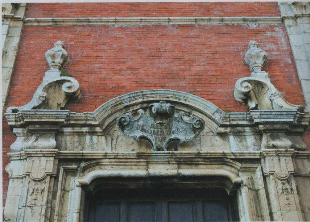
Il nome del paese ha origine proprio dalla torre, considerata come Mole Eterna